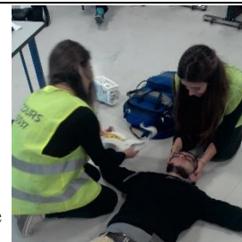
Formation Secourisme comprise